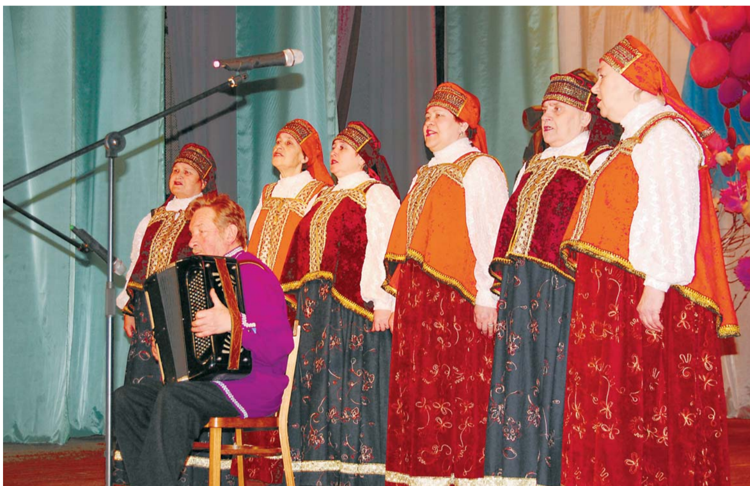
Вокальный ансамбль "Лейся, песня" (Трубичинский СДК) исполняет песню "На Волховском фронте".

В субботу, 21 февраля, в преддверии Дня защитника Отечества, в Пролетарском межпоселенческом центре культуры и досуга прошел районный фестиваль народного творчества в рамках Всероссийского фестиваля "Салют Победы", посвященного 65-летию Победы в Великой Отечественной войне 1941-1945 годов.