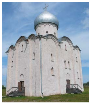
К 1150-летию Великого Новгорода. Архитектурное ожерелье города. Церковь Спаса Преображения на Нередице (1198 г). Новгородский район.