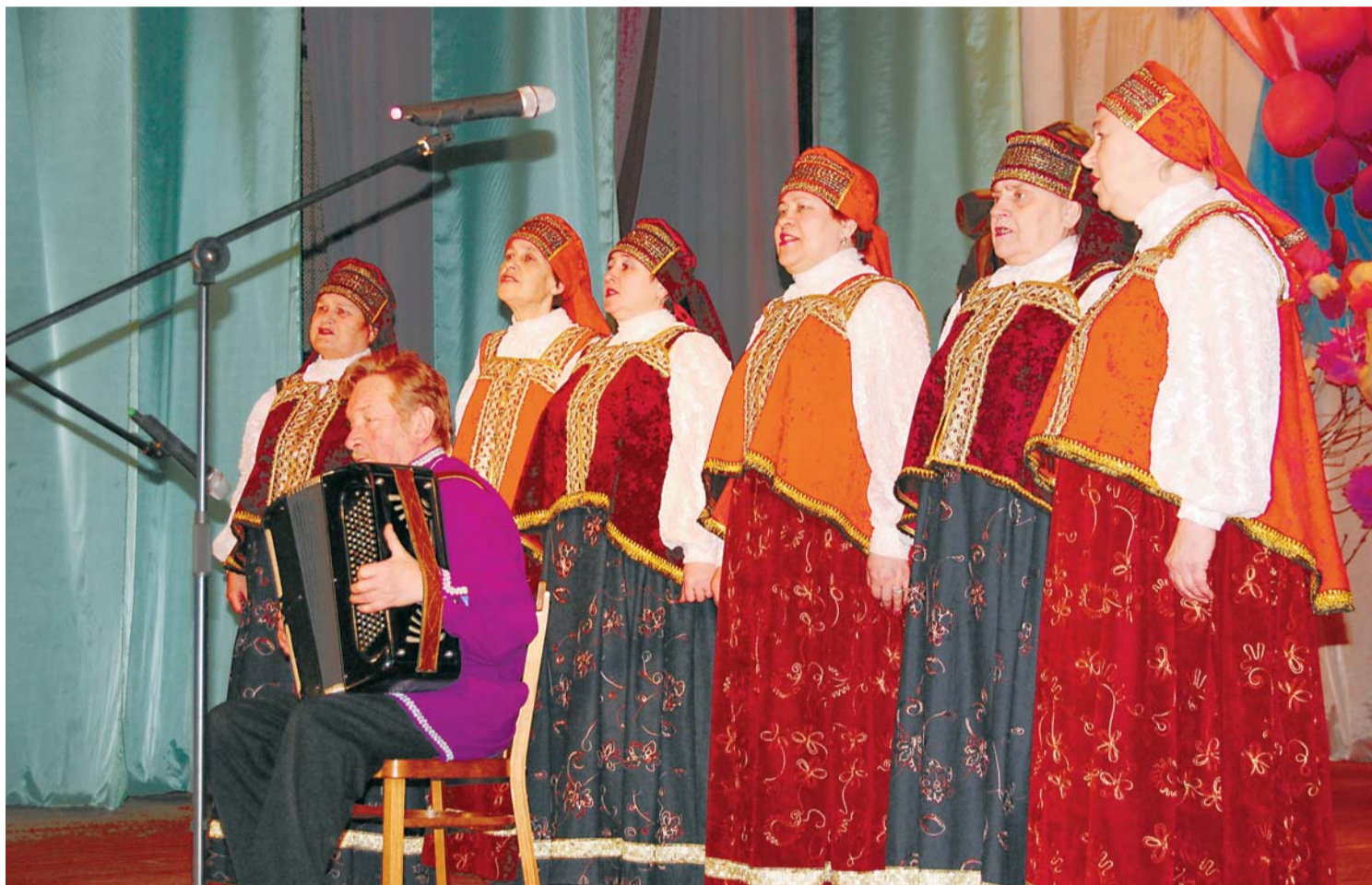
Вокальный ансамбль "Лейся, песня" (Трубичинский СДК) исполняет песню "На Волховском фронте".

В субботу, 21 февраля, в преддверии Дня защитника Отечества, в Пролетарском межпоселенческом центре культуры и досуга прошел районный фестиваль народного творчества в рамках Всероссийского фестиваля "Салют Победы", посвященного 65-летию Победы в Великой Отечественной войне 1941-1945 годов.