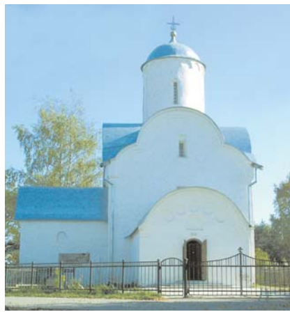
К 1150-летию Великого Новгорода. Архитектурное ожерелье города. Церковь Спаса на Волотовом поле, XIV век.