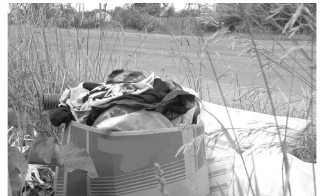
Свалка, устроенная дачниками на обочине дороги в деревне Новая Мельница в надежде, что кто-нибудь уберет этот мусор.

В 2006 году в границы Новомельницкого сельского поселения отошли дачные массивы Великого Новгорода, а это почти 36 тысяч дач. И таким образом, население пригородного села с началом дачного сезона увеличивается в 20 раз. Но деньги, заложенные на благоустройство, рассчитываются в бюджет поселения из расчёта 270 рублей на одного постоянно зарегистрированного по месту жительства. За три последних месяца 2008 года при скудном бюджете поселения истрачено на уборку и вывоз мусора с дачных массивов 87 тысяч рублей, вывезено 45 тонн мусора. И уже после уборки, нерадивые дачники стараются вынести мусор просто на обочину дорог, рассуждая, видимо, так: зачем захлампыть свой участок, когда власть в лице Администрации Новомельницкого сельского поселения уберёт бесплатно. А если не уберёт, мы позвоним в "инстанцию", пожалуемся, и их обяжут сделать это, как было весной текущего года.