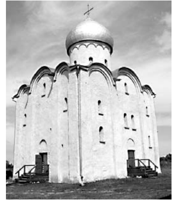
К 1150-летию Великого Новгорода. Архитектурное ожерелье города. Церковь Спаса Преображения на Нередице (1198 г). Новгородский район.

Официальный сайт Администрации Новгородского района: http://www.admnovray.natm.ru