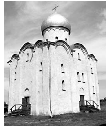
К 1150-летию Великого Новгорода. Архитектурное ожерелье города. Церковь Спаса Преображения на Нередице (1198 г). Новгородский район.

Официальный сайт Администрации Новгородского района: http://www.admnovray.natm.ru